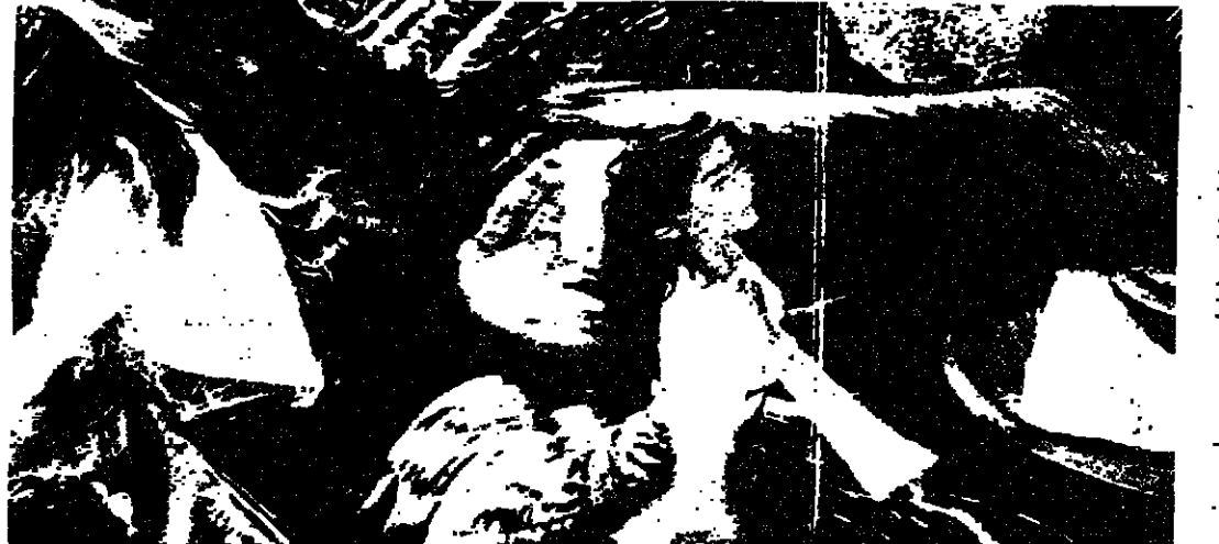
بعض التكوينات اللونية في وقصات الفيلم

فيلم رادا ولي حين يعود زويار السى بخيه لزيارة اخيه وبعض معارضة القدامى ونتم عشيقته له في احدى المدن القريبة تصل رادا مع بنت خفيها الى المدينة حيث تلقي نبيل وتذهب في ثرمة معه بعينه ومع باقي الفتيات الى دار الازياء في الوقت الذي ينتظ فيه زويار عجزري « لس دجاج » برشوة الحارس في السوق حيث يدعه لزيارة اخيه وهكذا يذهب زويار لينظر برادا الغامضة التي فتته ويسرق لاجلها جواذا ايلينا مما يثير حفيظة الحاكمين الذين يدمر رجالهم مخيم قبيلته ذلك تلك الطبيعة الساحرة التي صور فيها احداث فليمة كما ساعده ايضا كائيرا المصور الحائز سريغيفي فرانسكي ناعطياتها مع ما تمتع لا تقدر بلين مملسا اعطانا الفيلم كله ساعة ونصف من الوقت الذي لا يمكن ان ينساه المرء بسهولة . كلمة « الفجر » التي يفسحون السى السماء تحفة فنية وفكرية متميزة قل ان تضاهد مثلا لها سواء في لغتها السينمائية او في كل تلك المواقف والاشكال النبيلة التي يجعلها الفيلم تفصل الى المشاهد حاملة معها له اتمة والثقل على حد بناء لوتيانو السينمائي استغله المقتن